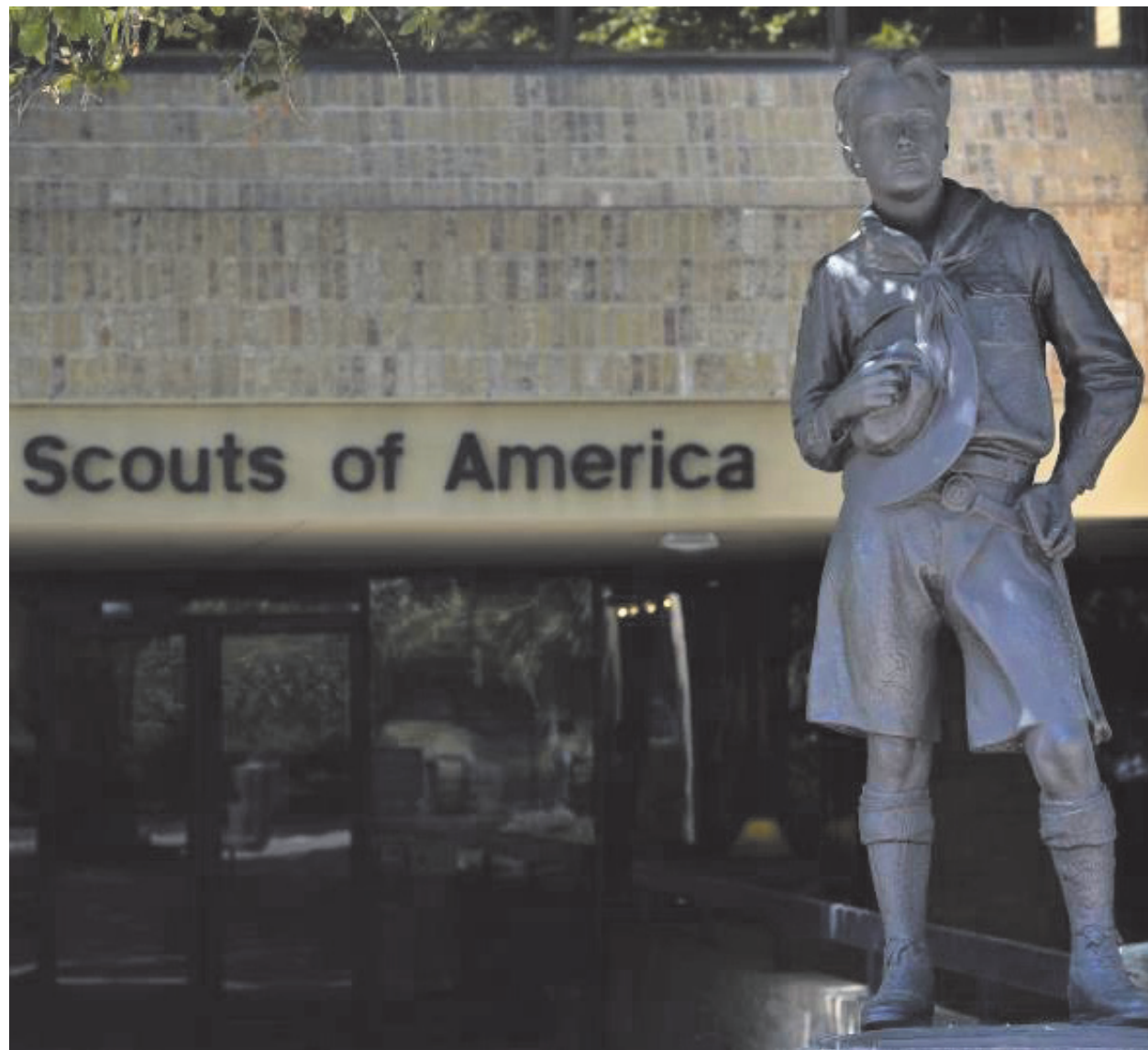
Los Boy Scouts registraron a casi 8 mil supuestos abusadores de menores.

"Codificamos 7.819 documentos, lo que significa que hay 7.819 personas que ellos creen que estuvieron involucradas en abusos sexuales a menores", dijo el pasado 30 de enero Warren.